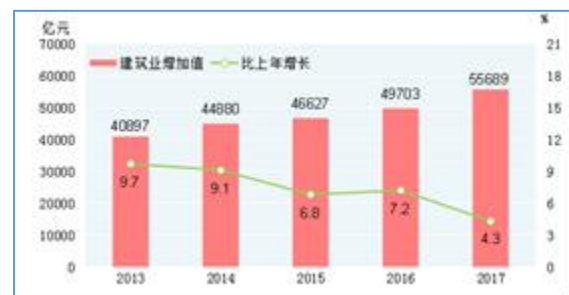
图1 2013~2017年中国建筑业增加值及其增长速度 (单位：亿元、%)

建筑行业为国民经济的重要支柱产业之一，周期性明显，其发展与固定资产投资密切相关。2010年以来，在国家宏观调控背景下，固定资产投资增速持续放缓，相应建筑业增速有所下降，但在国家保障房、水利建设、铁路投资等基础设施建设投资的支持下，建筑业增加值保持增长态势。2017年，全社会建筑业增加值55689亿元，比上年增长4.3%；增速同比有所下降。