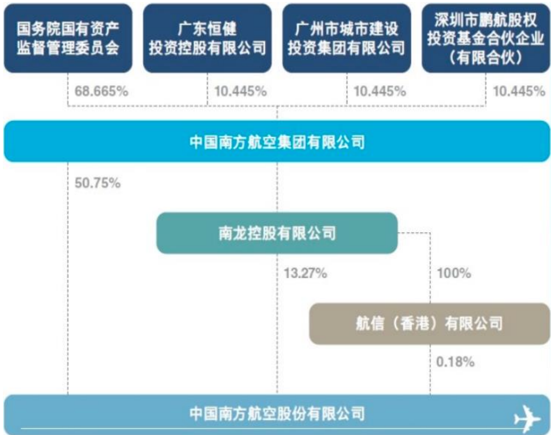
附件 1-1 截至 2021 年底公司股权结构图