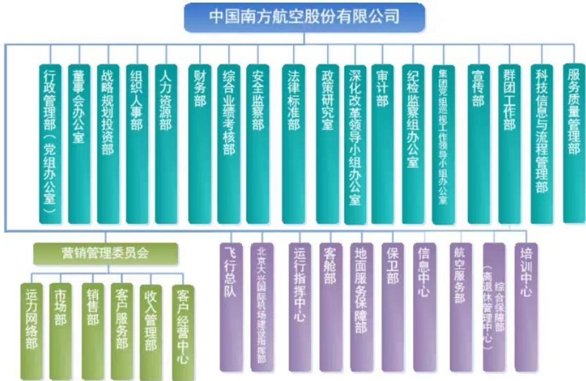
附件 1-2 截至 2021 年底公司组织结构图