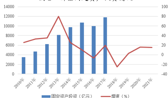
图 2 新疆固定资产投资情况

注：2018 年起，新疆未披露固定资产投资额的绝对值