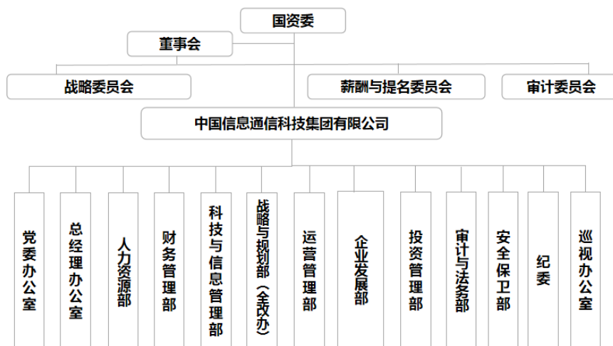
附件 1-2 截至 2023 年 3 月底中国信息通信科技集团有限公司组织架构图