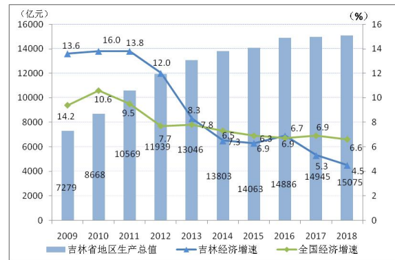
图1 吉林省地区生产总值及增速情况

注：地区生产总值按当年价格计算；增速按不变价格计算