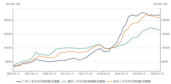
图3 广州、重庆、武汉二手住宅价格指数（定基数）

截至本次资产池跟踪基准日，资产池未偿本金余额占比最大的三个城市为广州、重庆和武汉，其住宅价格指数如图3所示。