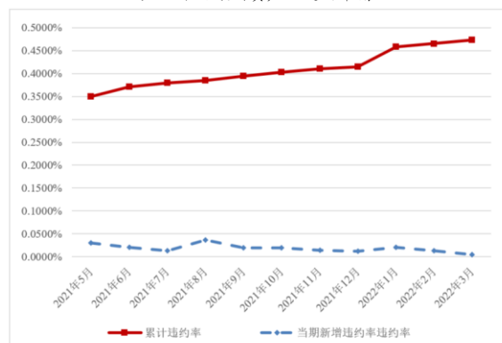
图 2 跟踪期内资产池违约率情况

注: 1. 累计违约率 = \text{累计违约贷款金额} / \text{初始起算日资产池本金余额} ;