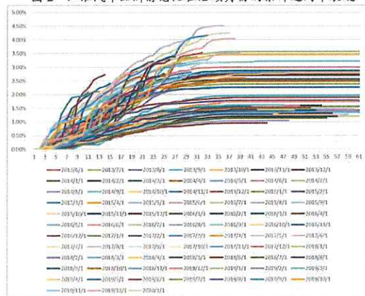
图 2 江淮汽车品牌静态池在后续月份的累计违约率表现

瑞福德汽车金融分别提供了江淮汽车品牌和非江淮汽车品牌的静态池历史数据, 联合资信整理了江淮汽车品牌 2013 年 6 月—2020 年 5 月的 84 个静态池的数据 (2013 年 3 月—2013 年 5 月数据笔数少, 2020 年 6 月—2020 年 11 月观测周期短, 未作参考) 和非江淮汽车品牌 2014 年 9 月—2020 年 6 月的 69 个静态池的数据 (2013 年 11 月—2014 年 8 月数据笔数少, 2020 年 6 月—2020 年 11 月观测周期短, 未作参考), 分别计算了逾期 30 天以上累计违约率来进行观察。静态池在后续月份的累计违约率表现如下: