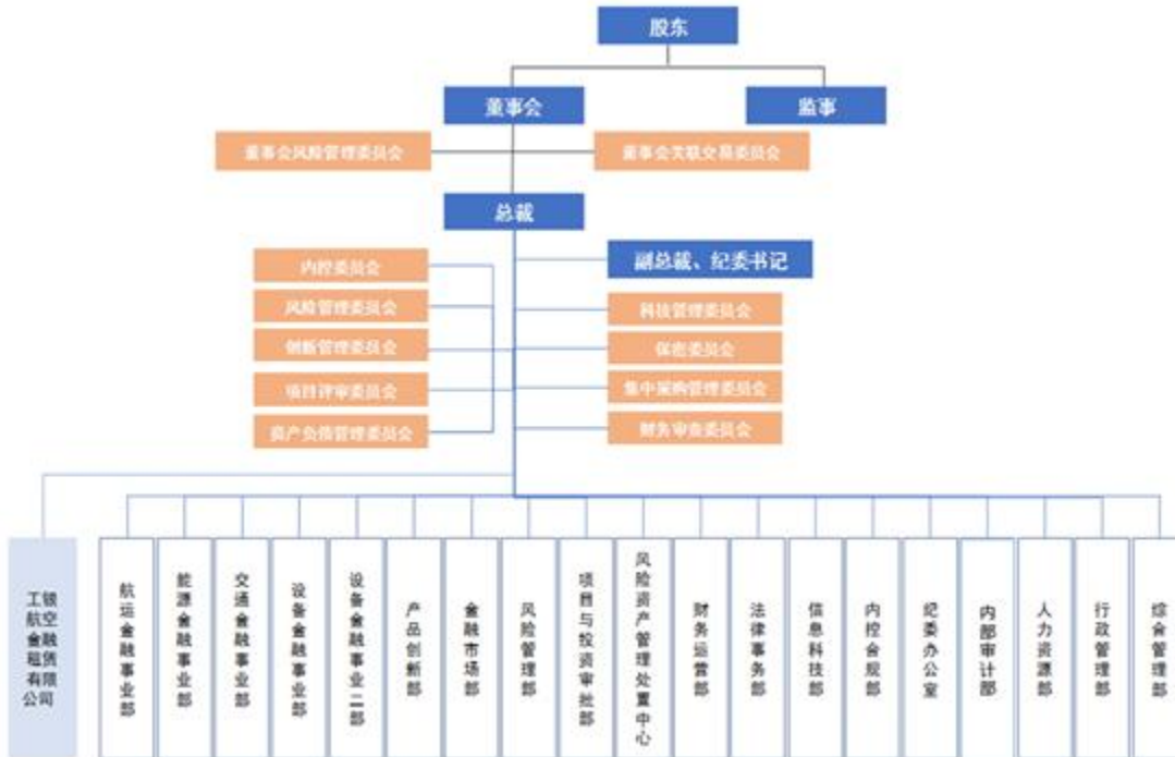
附录 1 2020 年 6 月末公司组织结构图