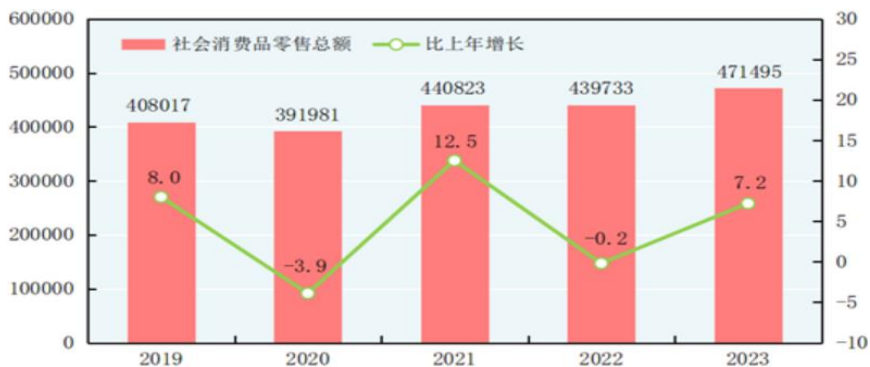
图 1 2019—2023 年中国社会消费品零售总额变动情况（单位：亿元、%）

2024 年前三季度，社会消费品零售总额 353564 亿元，同比增长 3.3%，保持低位增速。限额以上零售业单位中各业态表现较上半年变化不大，2024 年 1—9 月，限额以上零售业单位中便利店、专业店、超市零售额同比分别增长 4.7%、4.0%、2.4%，表现总体平稳；百货店、品牌专卖店零售额延续 2024 年以来的下降趋势，分别下降 3.3%和 1.7%；全国网上零售额 108928 亿元，同比增长 8.6%，维持最高增速。