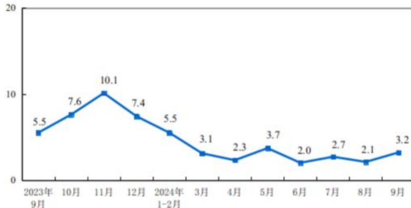
图 2 2024 年前三季度社会消费品零售总额同比增速情况（单位：%）