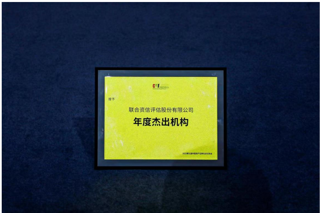
联合资信获 CSF 论坛 2022 年度杰出机构嘉勉

作为国内资产证券化行业认可度高、影响力大的行业交流平台，历届中国资产证券化论坛（CSF）年会均受到了国内外资产证券化行业的密切关注和积极参与。