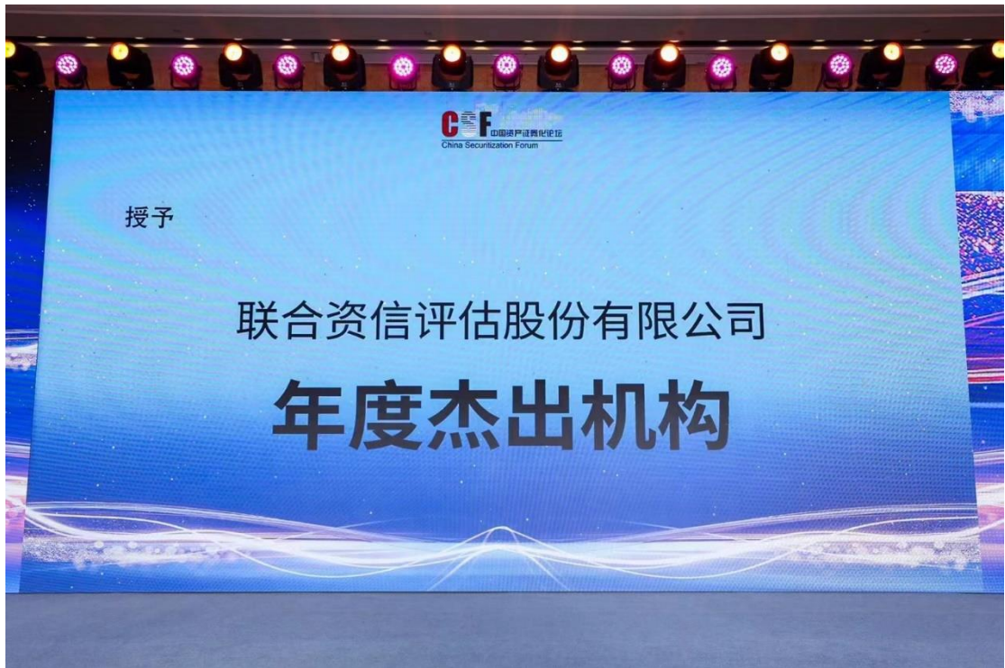
嘉勉晚宴上，联合资信获 CSF 论坛 2022 年度杰出机构嘉勉展示