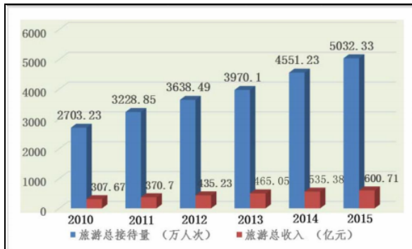
图 1 2010~2015 年旅游接待量与旅游总收入图