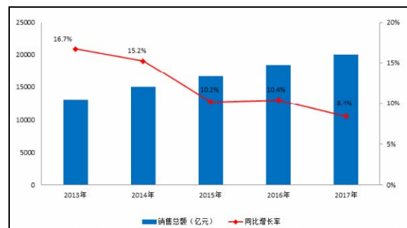
图 1 2013~2017 年药品流通行业销售趋势

产企业采购，造成大型分销企业对中小分销企业销售下降；医保控费、药占比限制等政策实施推动药品招标价格和用量持续下降，造成分销企业对医疗终端销售下降；加上大型企业销售渠道整合及业态结构调整尚未完成，最终导致其销售增速放缓。在此背景下，大型药品批发企业也在通过兼并重组的外延式增长和积极开发终端市场的内生式增长方式，不断增强自身分销业务能力。