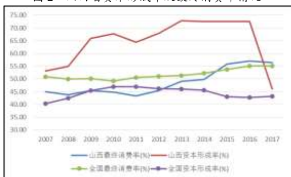
图2 山西省资本形成率及最终消费率情况

2007—2016年,山西省资本形成率和最终消费率均波动上升,资本形成率高于全国平均水平;2017年,受山西省化解过剩产能和产业结构调整影响,山西省国民经济生产总值有所上升,山西省资本形成率快速下降,最终消费率小幅下降。由山西省资本形成率及最终消费率看出,山西省经济增长主要依靠投资及消费拉动。投资主要方向包括房地产业,制造业,电力、燃气及水的生产和供应业,水利、环境和公共设施管理业,采矿业,交通运输、仓储和邮政业等。2017年,山西省全社会固定资产投资规模为6140.9亿元,同比增长6.3%;2018—2019年山西省全社会固定资产投资比上年分别增长5.7%和9.3%。近年来,山西省固定资产投资增速呈上升趋势。分产业来看,山西省固定资产投资以一、三产业为主,2019年固定资产投资(不含农户)中,第一、二、三产业投资分别比上年增长16.3%、5.3%和11.4%,其中基础设施投资增长13.9%。工业投资中,企业技改投资增长20.9%;制造业投资增长0.1%;煤炭工业投资增长16.7%,非煤工业投资增长3.1%。