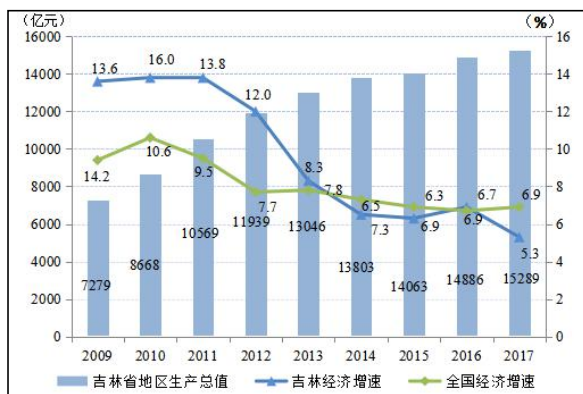
图 1 吉林省地区生产总值及增速情况